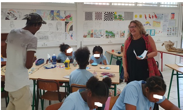
La rectrice Christine Gangloff-Ziegler en visite au collège d'Anse-Bertrand.

Basé sur le volontariat des élèves autant que de l'équipe pédagogique et de l'établissement qui les accueille, le dispositif Ecole ouverte est mis en place pendant les courtes périodes de vacances scolaires, particulièrement à destination des élèves, collégiens et lycéens des établissements situés en éducation prioritaire.